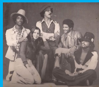
The Dedhalavie Combo